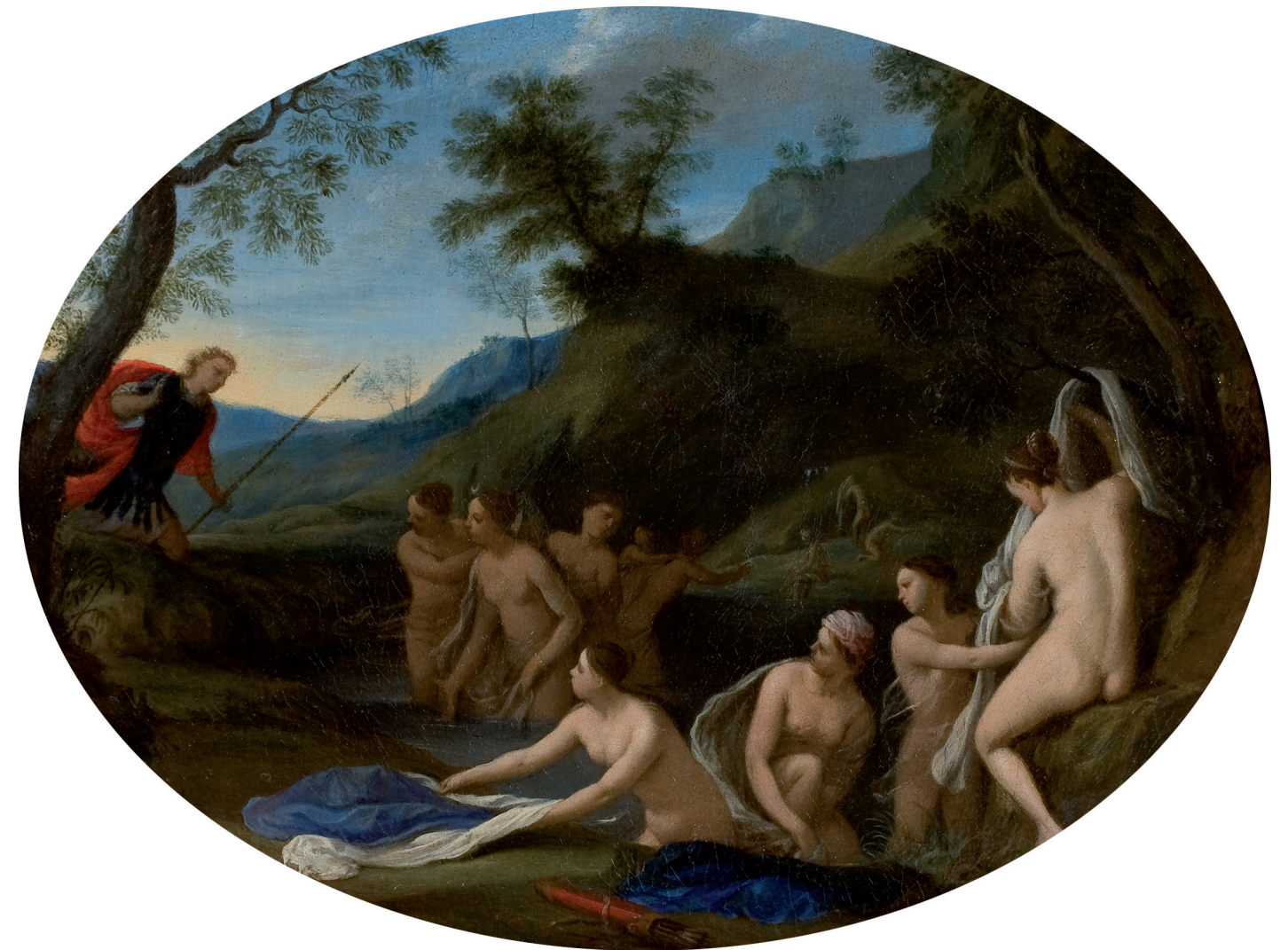
Pier Francesco Cittadini (Milano 1613/16- Bologna 1681) Diana e Atteone Olio su tela

Le macchie che compaiono sul volto sono frutto di un'alterazione del cartone su cui è dipinta la figura.