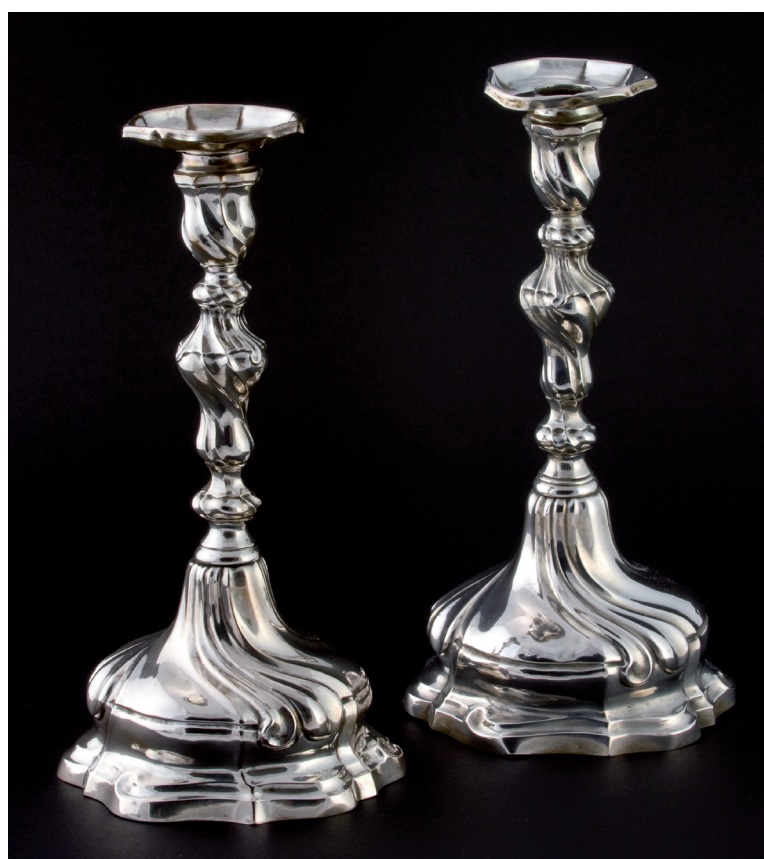
Silvestro Paltrinieri (notizie dal 1776 al 1812) Coppia di candelieri Ultimo quarto del XVIII secolo