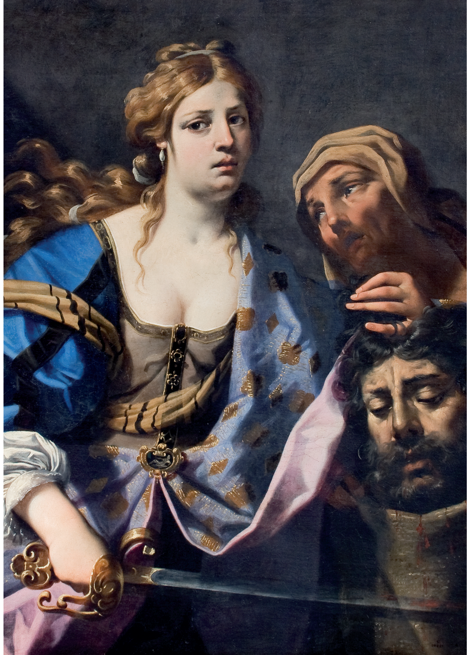
Giuseppe Manzini Junior (notizie dal 1775 al 1796) Coppia di alzate Ultimo quarto del XVIII secolo