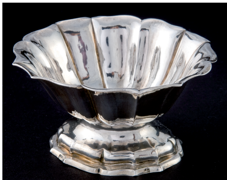
Vincenzo Parlaschi (notizie dal 1771 al 1795) Zuccheriera Ultimo quarto del XVIII secolo

Essa comprende esemplari recanti il marchio del Ducato -l'aquila estense- riferibili, quindi, sicuramente alla produzione degli argentieri modenesi attivi tra XVIII e XIX secolo e costituisce una preziosa testimonianza dell'attività delle botteghe orafe cittadine nel settore dell'arredo domestico.