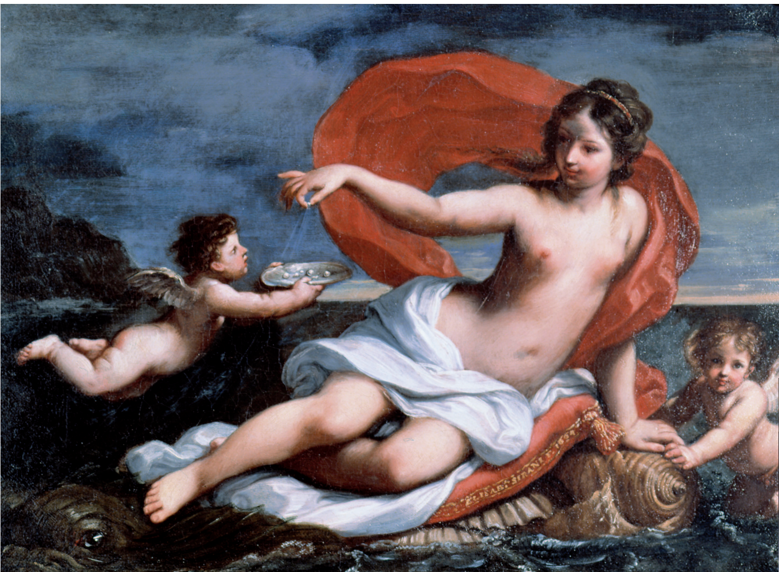
Elisabetta Sirani (Bologna 1638 - 1665), Galatea , 1664, Olio su tela